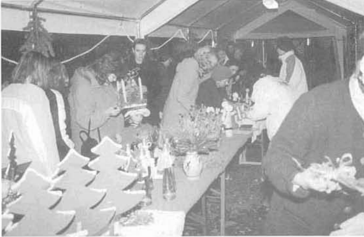
(Bericht und Foto: Thalhammer)

Ein gut besuchter Adventsmarkt fand am Vorabend zum ersten Adventssonntag auf dem Platz vor der Kirche und dem Kloster statt. Eine besinnliche Feier in der Kirche wurde von den Kindergartenkindern unter Leitung von Silke Kitzberger mitgestaltet. Nach der Segnung der Adventskränze durch Pfarrkurat Pater Heißig erwartete die Kirchenbesucher und viele andere ein Adventmarkt mit drei Ständen – einer vom Kindergarten-Elternbeirat mit schönen Bastelarbeiten (Foto), einer von der Frauengemeinschaft mit Plätzchen und Stollen und ein Zelt mit Brotzeiten und Glühwein vom Kindergartenförderverein.