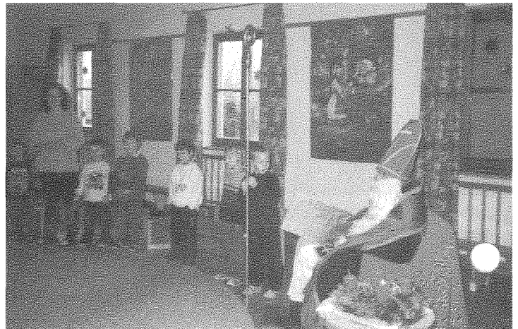
(Bericht und Foto: Helmut Rasch)

Für ihren Fleiß, für Aufmerksamkeit und vor allem für ihr verständnisvolles Zusammenleben belohnte Nikolaus dann Klein und Groß mit seinen Gaben. Als er den Gemeinschaftsraum verließ, brach die Freude über die besondere Begegnung hervor, die den Kindern in Erinnerung bleiben wird.