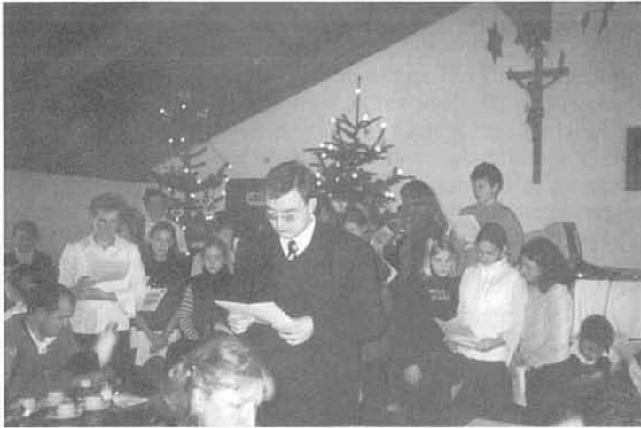
(Bericht und Foto: Helmut Rasch)